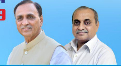
શ્રી વિજયભાઈ રૂપાણી માન. મુખ્યમંત્રી, ગુજરાત રાજ્ય