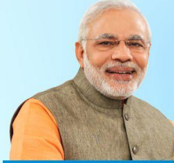
શ્રી નરેન્દ્રભાઈ મોદી માન. પ્રધાનમંત્રી અને કૃષિ મહોત્સવના પ્રણેતા

તારીખ : ૨૬ મે, ૨૦૧૭, શુક્રવાર સમય : સવારે ૯-૦૦ કલાકે સ્થળ : પોલીસ પરેડ ગ્રાઉન્ડ, આહવા, જિ. ડાંગ